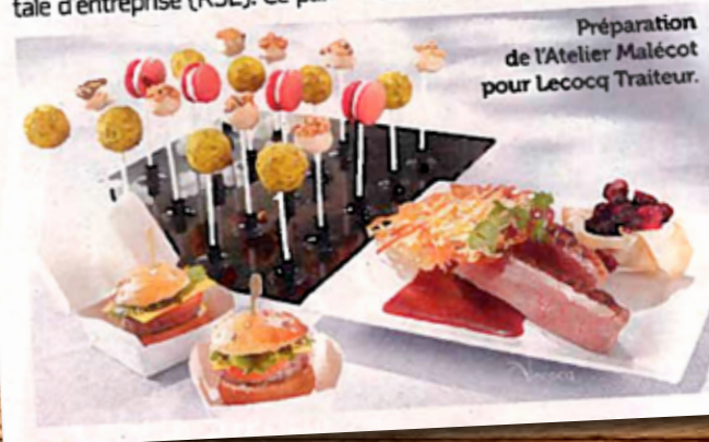
Préparation de l'Atelier Malécot pour Lecocq Traiteur.

Le TOR Lecocq Traiteur (Compass Group France) a signé un partenariat avec Les Papillons blancs de Lille. En s'engageant auprès des Ateliers Malécot, établissement de travail avec l'association Les Papillons blancs de Lille, qui ont pour vocation de favoriser l'insertion professionnelle des personnes en situation de handicap, Lecocq Traiteur commercialise, auprès de ses propres clients, la bière locale Léonce d'Armentières que fabriquent les travailleurs en situation de handicap des Ateliers Malécot, valorisant ainsi leur travail et savoir-faire.