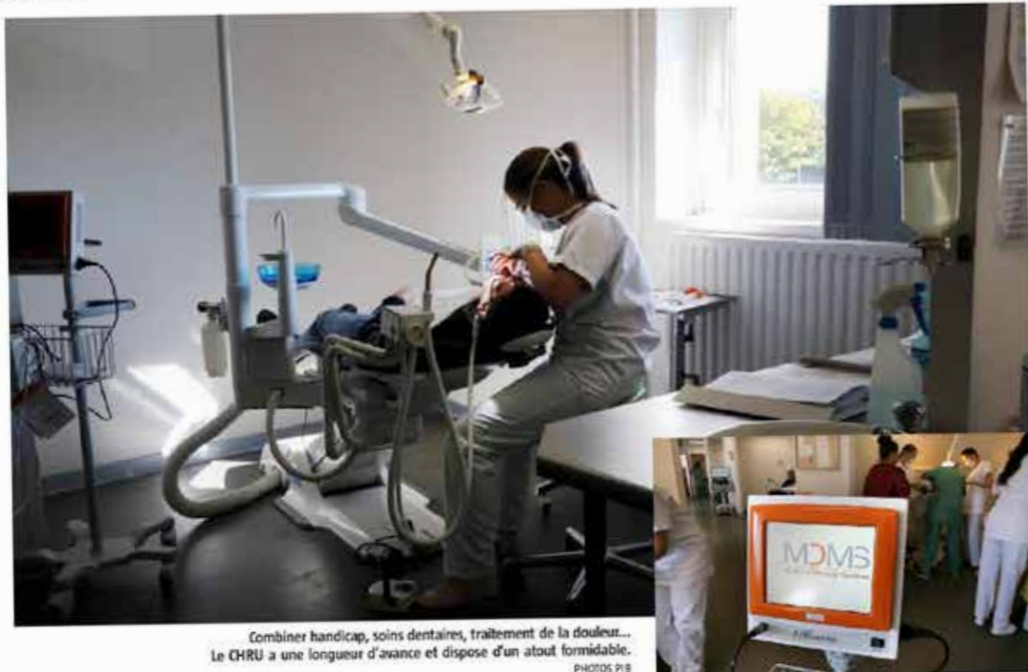
Combiner handicap, soins dentaires, traitement de la douleur... Le CHRU a une longueur d'avance et dispose d'un atout formidable.

« Nous allons pouvoir traiter de façon éthique des patients incapables de se plaindre. Ce sera source de confort... »